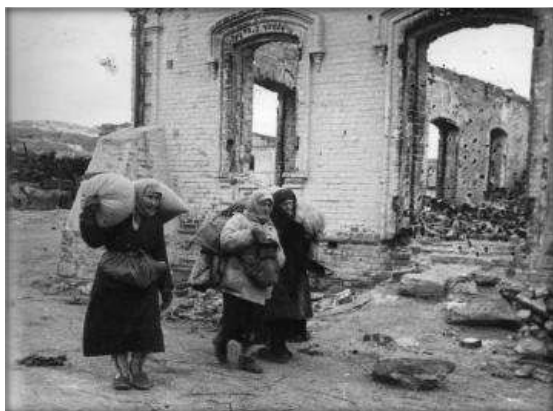
Жители освобожденной Цимлянской возвращаются в свои дома, февраль 1943 года.

В бою за станицу Цимлянскую уничтожено 300 немецких солдат и офицеров, подбито 15 танков, сожжено 12 и захвачено 20 автомашин, а также освобождён лагерь советских военнопленных.