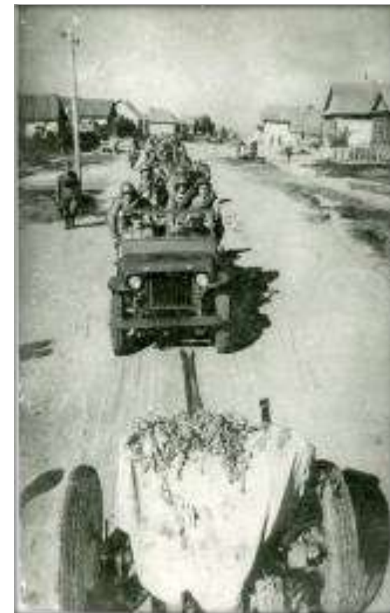
Противотанковая часть действующей армии вступает в станицу Цимлянская.

Только 5 января 1943 года станица Цимлянская, все станицы и хутора Цимлянского района были освобождены от фашистских оккупантов. Задача, возложенная на командира бригады полковника Студеникина, была полностью выполнена.